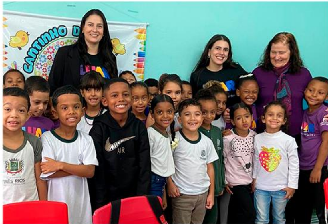
Escola e Comunidade