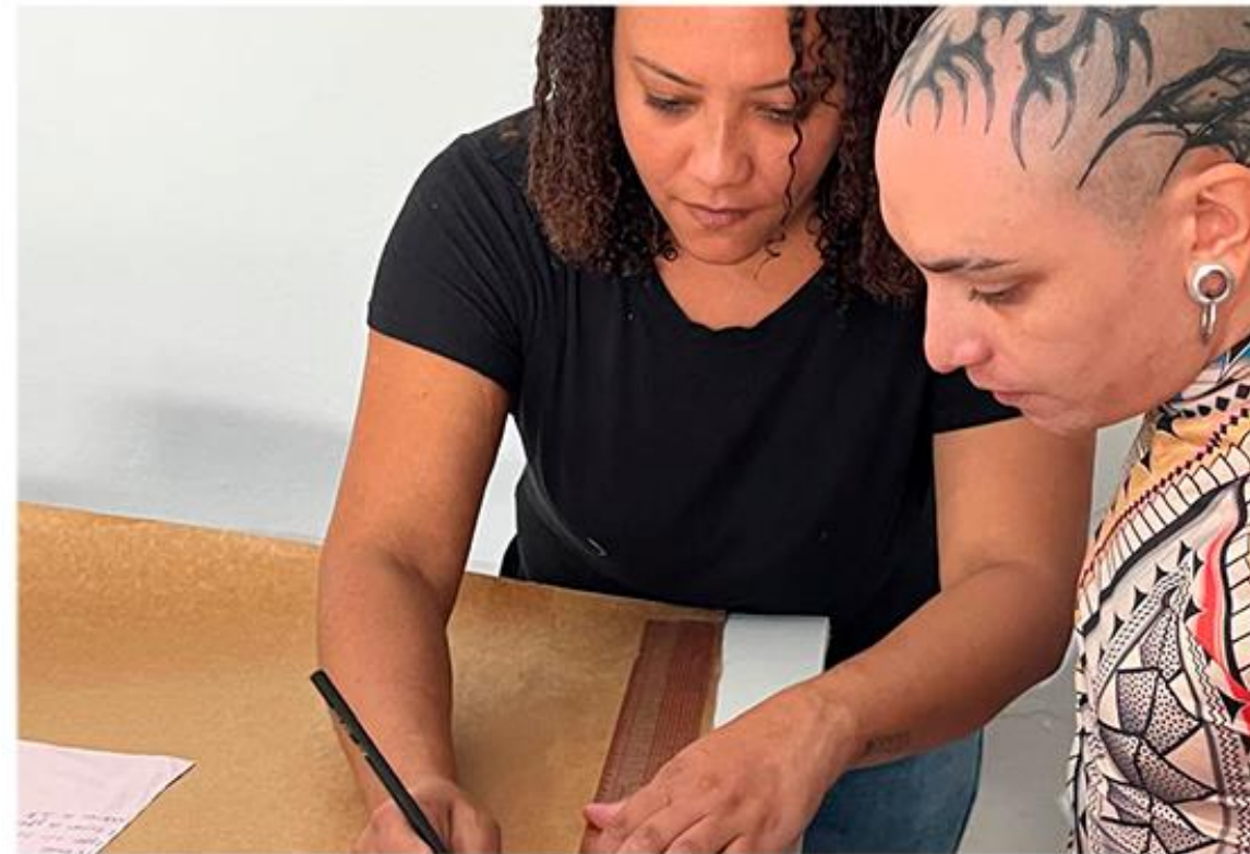
Emprego e Renda